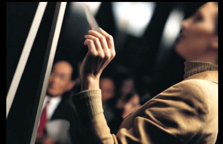
Formation en Finance Quantitative