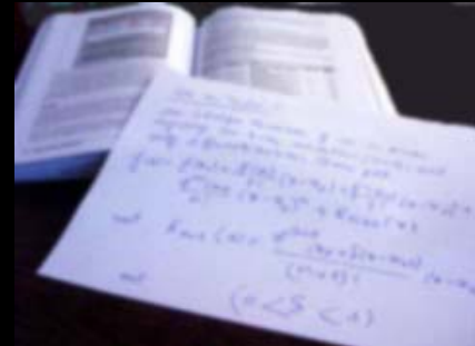
Formation en Finance Quantitative